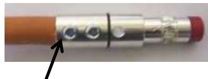
Cavo o manicotto montato su un contatto