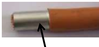
Manicotto riduttore / manicotto terminale adatto

Tutti questi manicotti si adattano perfettamente tra loro e creano una riduzione graduale della portata. L'estremità allargata dei manicotti dovrebbe appoggiare sull'isolamento del cavo.